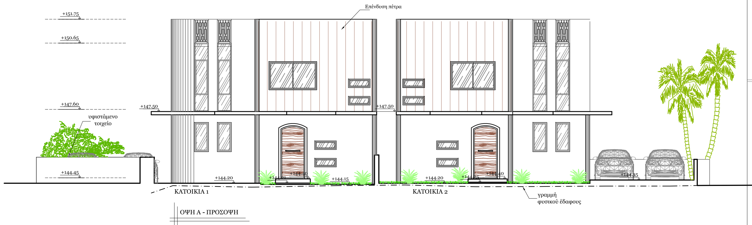
ΟΨΗ Α - ΠΡΟΣΟΨΗ